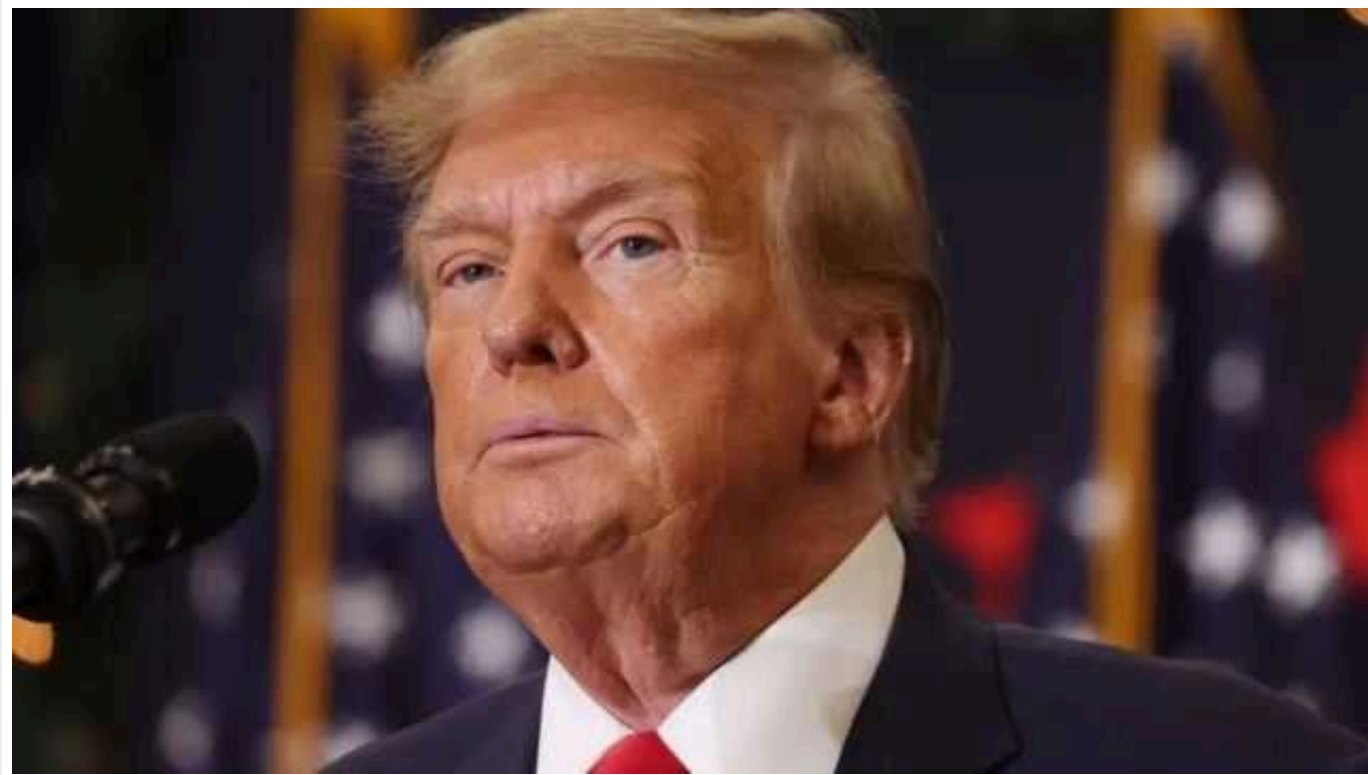
Трамп за час президентства отримав від іноземних організацій щонайменше 7,8 мільйона доларів

Калиній президент США Дональд Трамп отримав щонайменше 7,8 мільйона доларів від іноземних організацій у 20 країнах, що може порушувати конституційну заборону на отримання фінансування від урядів інших держав.