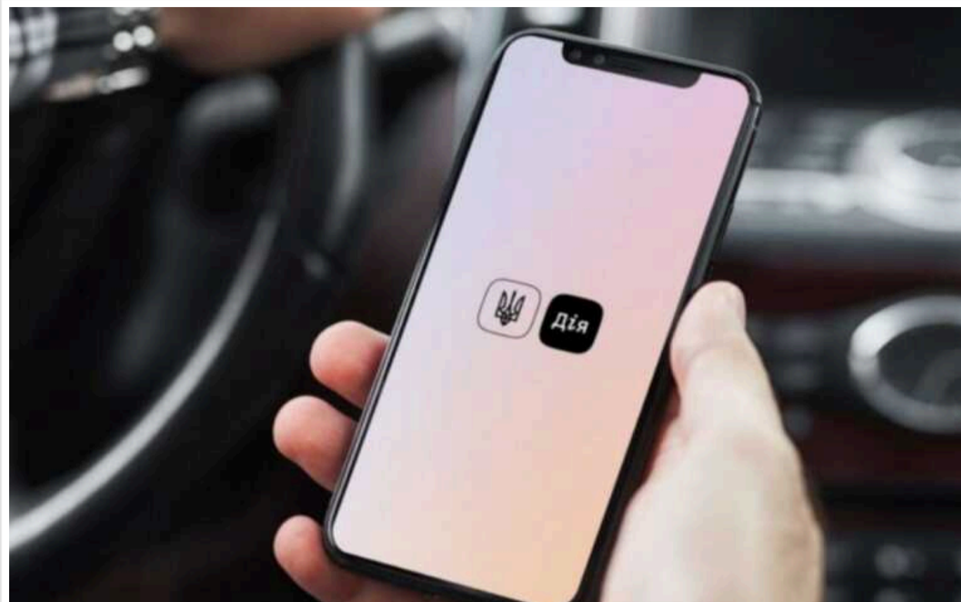
У Верховній Раді зареєстрували новий законопроект: розмитнення авто в "Дії"

Верховна Рада отримала на розгляд законопроект №10380, який передбачає вилучення людського чинника з процесу розмитнення.