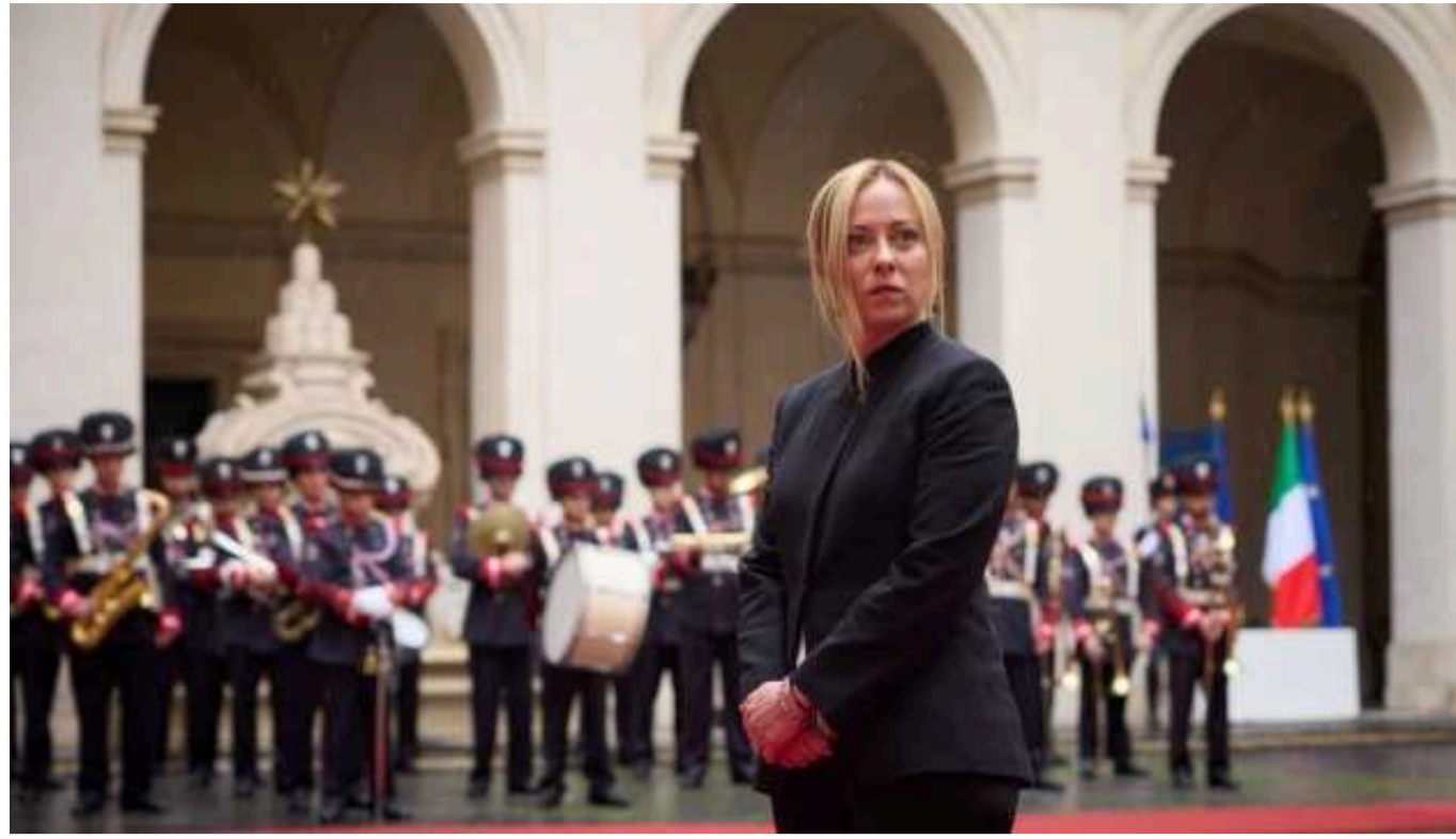
В Італії виступають за подальшу передачу зброї Україні

Лише подальша передача Україні зброї дасть змогу забезпечити баланс на полі бою.