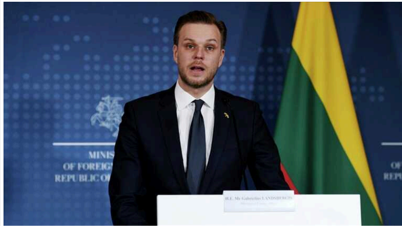
Литва висловила Росії протест через недавні атаки на Україну

До Міністерства закордонних справ Литви викликали представника посольства Росії у Вільнюсі, де йому висловили рішучий протест у зв'язку з нещодавніми ракетними та безпілотними ударами по Україні.