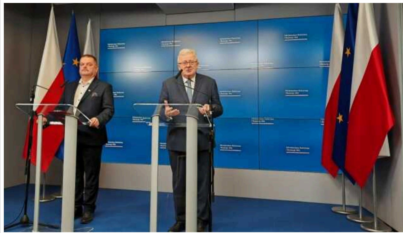
Ембарго на імпорт українських продуктів є безстроковим - польський міністр

Ембарго на українські продукти буде безстроковим - до окремого розпорядження про його відміну.