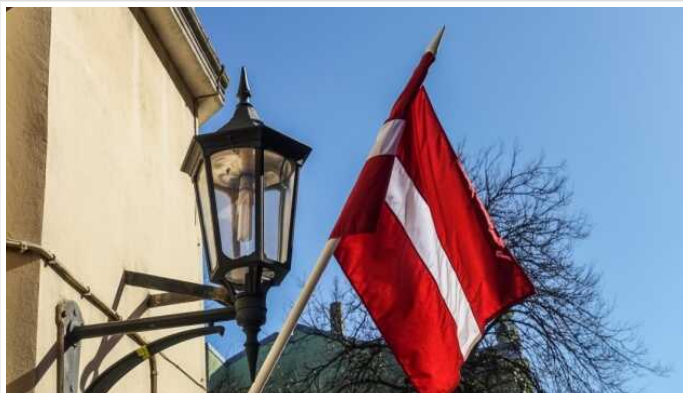
У Латвії пропонують заборонити імпорт російського та білоруського зерна до ЄС

Міністр транспорту Латвії Каспарс Брішкенс запропонував заборонити імпорт російського та білоруського зерна до країн ЄС.