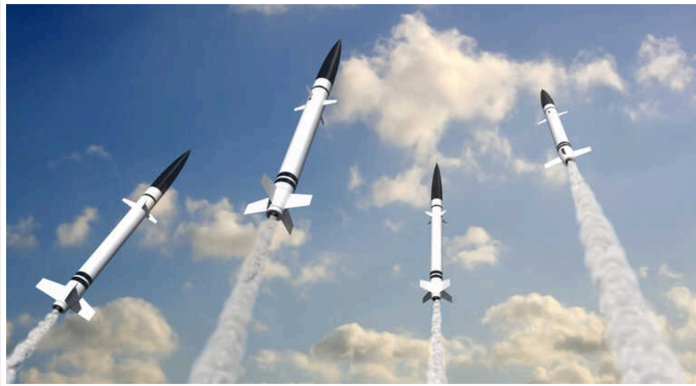
В останні тижні РФ отримала від КНДР кілька десятків балістичних ракет, - The Wall Street Journal

Уже навесні Російська Федерація може розпочати процес закупівлі балістичних ракет короткого радіусу дії в Ірану. Процес переговорів в цьому напрямку активно розвивається.