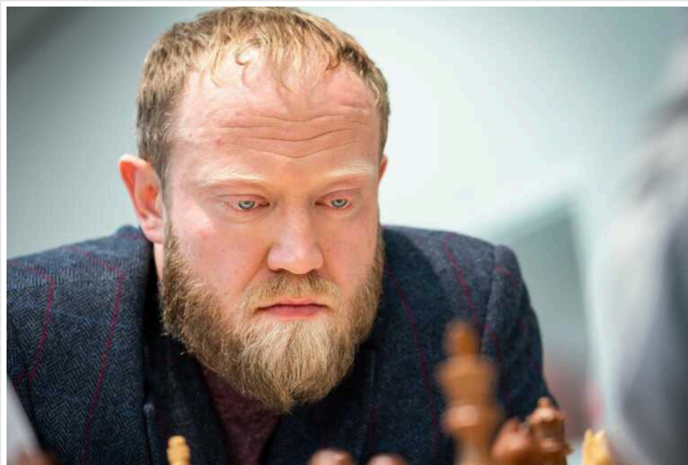
Російський шахіст відреагував на відмову поляка потиснути йому руку на ЧС

Російський шахіст Денис Хісматуліні не скаржиться на польського гросмейстера Яна-Кшиштофа Дуду, який відмовився тиснути йому руку на чемпіонаті світу. Представник країни-агресорки, який активно підтримує війну проти України, зазначив, що не погоджується з вчинком суперника.