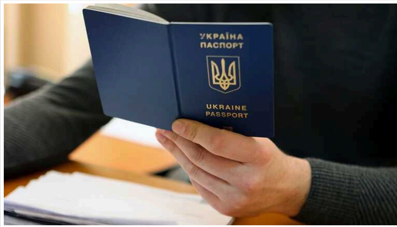
В Україні підвищили ціни на отримання паспорта

В Україні з 1 січня 2024 року здорожчало оформлення низки документів. Зокрема зробити за 10 робочих днів паспорт громадянина у формі ID-картки тепер коштує 874 грн, тоді як раніше було 820 грн. Таким чином, подорожчання становило 54 грн.