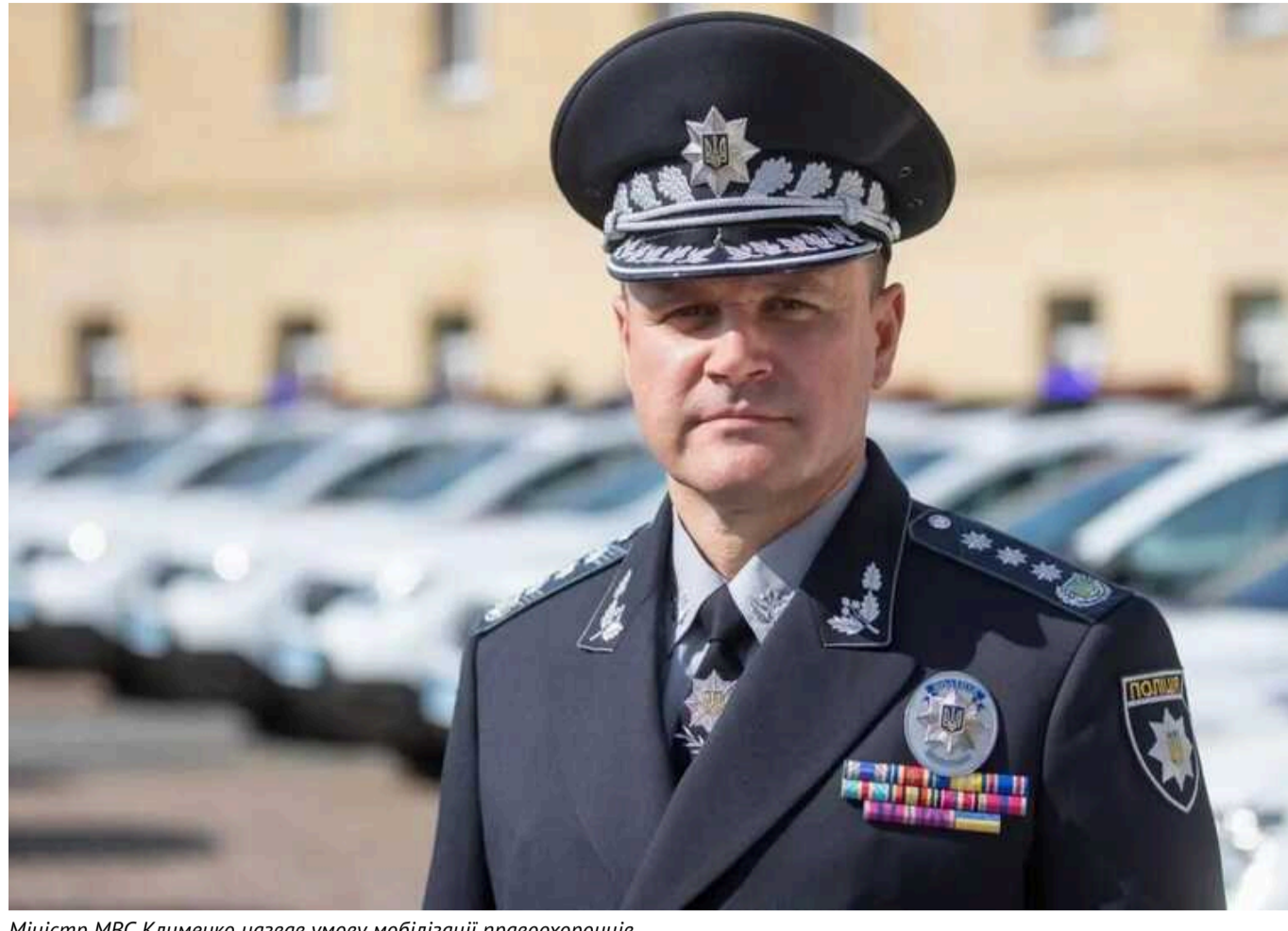
Міністр МВС Клименко назвав умову мобілізації правоохоронців

Якщо ситуація у країні погіршуватиметься, правоохоронці будуть готові стати до зброї та мобілізуватись.