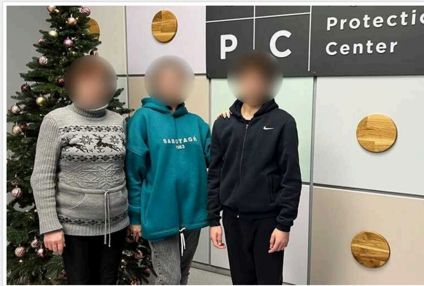
Ще одну дитину повернули з окупованої частини Херсонської області

Ще одну українську дитину вдалося повернути з окупованої частини Херсонської області.