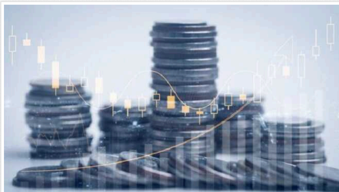
«Гнучкий стратегічний дороговказ» влади, який лякає

Якщо влада все ж вирішила йти неочевидним шляхом фіскалізації заради зростання, то хочеться хоча б аргументи на користь цього вибору побачити.