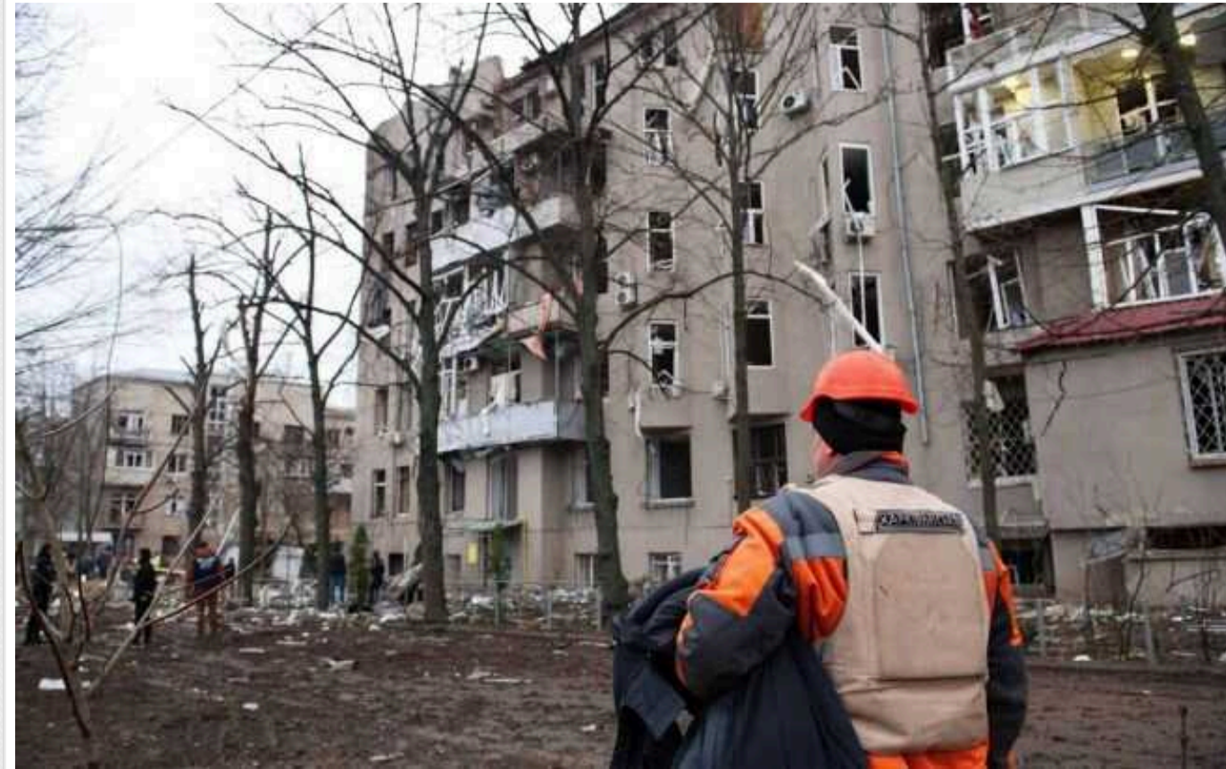
Збільшилася кількість постраждалих через ракетну атаку по Харкову 2 січня

Число постраждалих у Харкові внаслідок ракетної атаки 2 січня збільшилося. Поранення отримали 63 особи.