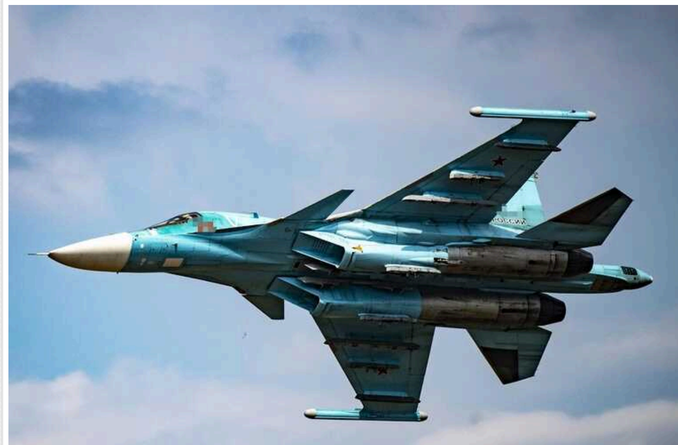
Спецоперація ГУР: у РФ на аеродромі згорів Су-34

У ніч проти 4 січня на аеродромі "Шагол" у російському Челябінську згорів винищувач-бомбардувальник Су-34. За успішною операцією стоїть ГУР.