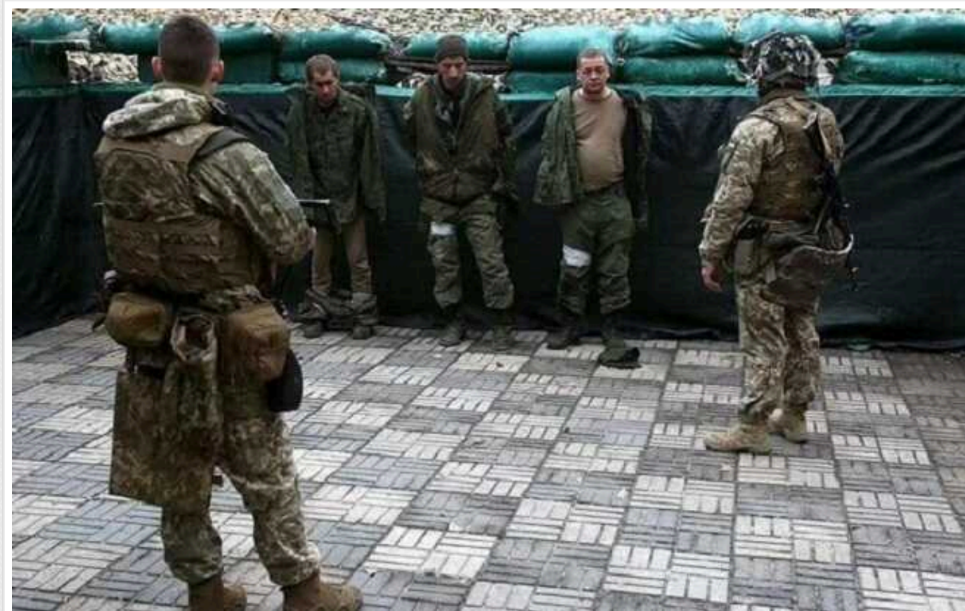
FT: Більше 220 окупантів здалися в полон через лінію "Хочу жити"

Станом на грудень понад 220 російських солдатів здалися в полон через гарячу лінію "Хочу жити", ще понад 1 000 інших заявок перебувають на розгляді.