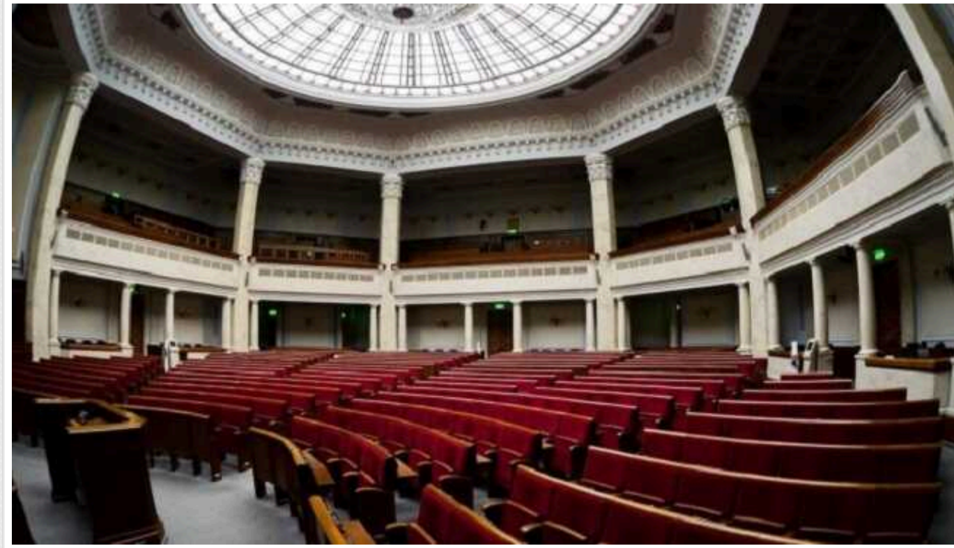
Комітет Ради почав розгляд нового закону про мобілізацію: присутні Залужний та Умеров

Про це повідомив голова фракції "Слуга Народу" Давид Арахамія.