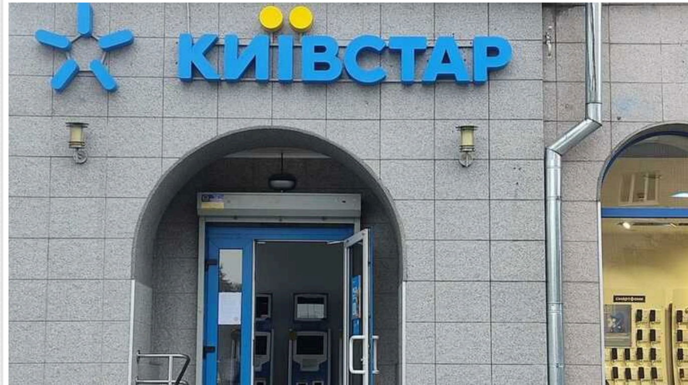
СБУ: Хакери проникли в систему "Київстару" за місяці до атаки та викрали дані абонентів

Російські хакери проникли в систему "Київстару", принаймні, у травні минулого року і могли викрасти дані абонентів до масштабної атаки 12 грудня.