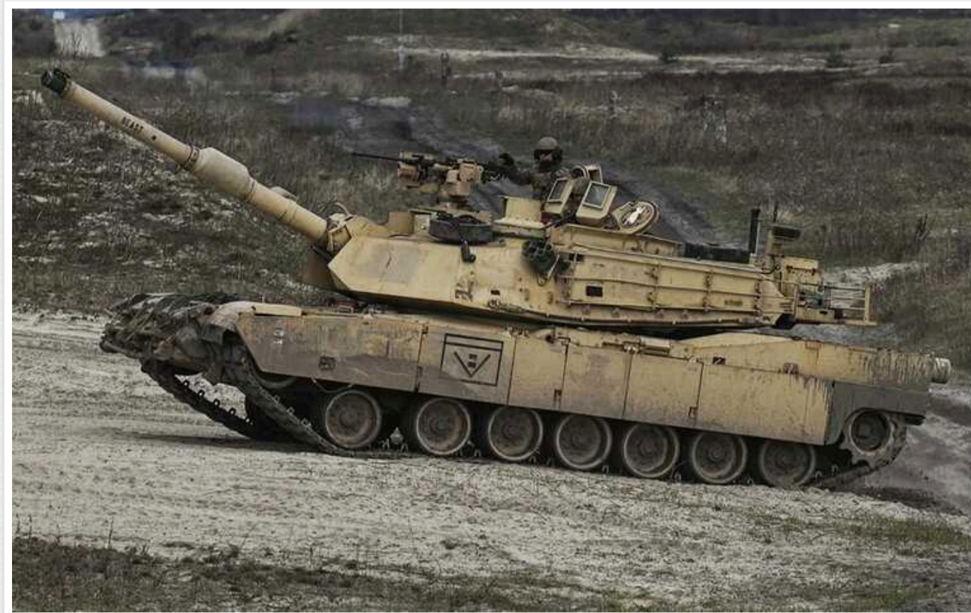
Танки Abrams поки не проявили себе під час війни в Україні, – Forbes

Танки Abrams поки не проявили себе в ході війни в Україні, хоча минуло вже два місяці з моменту їх поставки, пише Forbes.