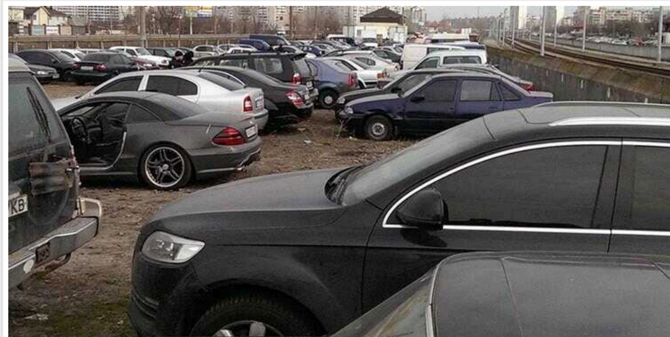
Поліція Києва переплачує за оренду штрафмайданчиків, — НАЗК