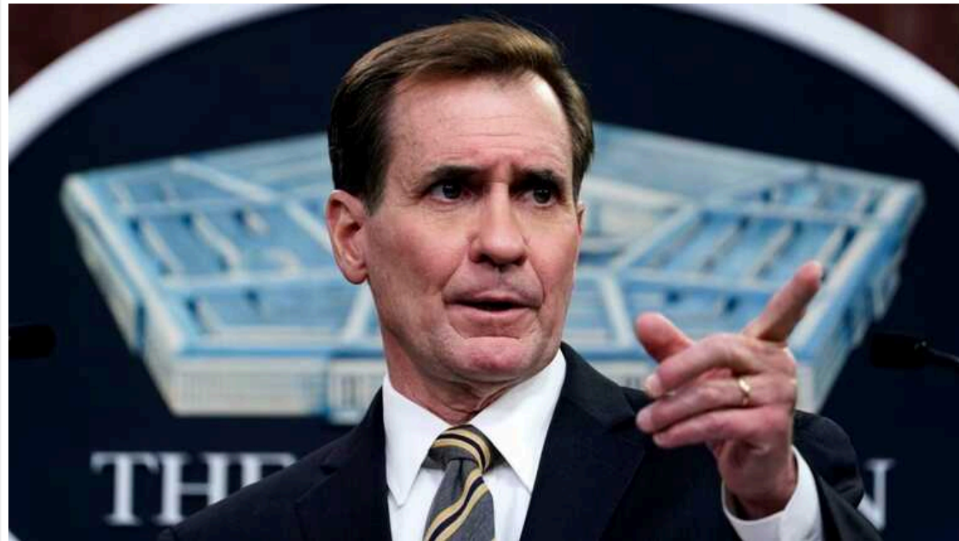
США не виявили ознак нецільового використання військової допомоги Україні

Сполучені Штати не виявили ознак нецільового використання військової допомоги Україні. Уся техніка використовується на полі бою.