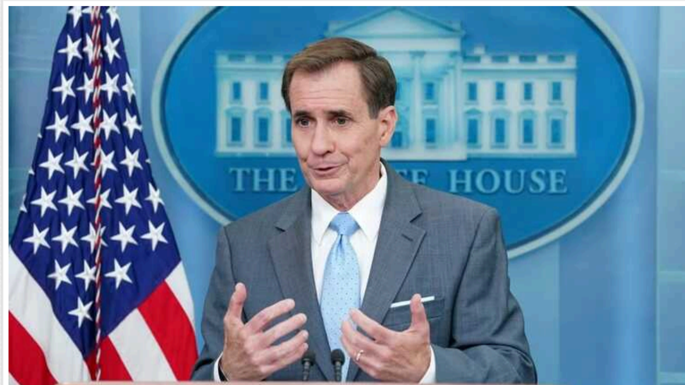
У Білому домі відповіли на "сигнали" Путіна про закінчення війни: "Не схожий на того, хто хоче переговорів"

В адміністрації американського президента Джо Байдена сумніваються, що російський диктатор Володимир Путін хоче закінчення війни в Україні. Глава Кремля, як зазначили у Білому домі, не схожий на людину, яка хоче мирних переговорів.