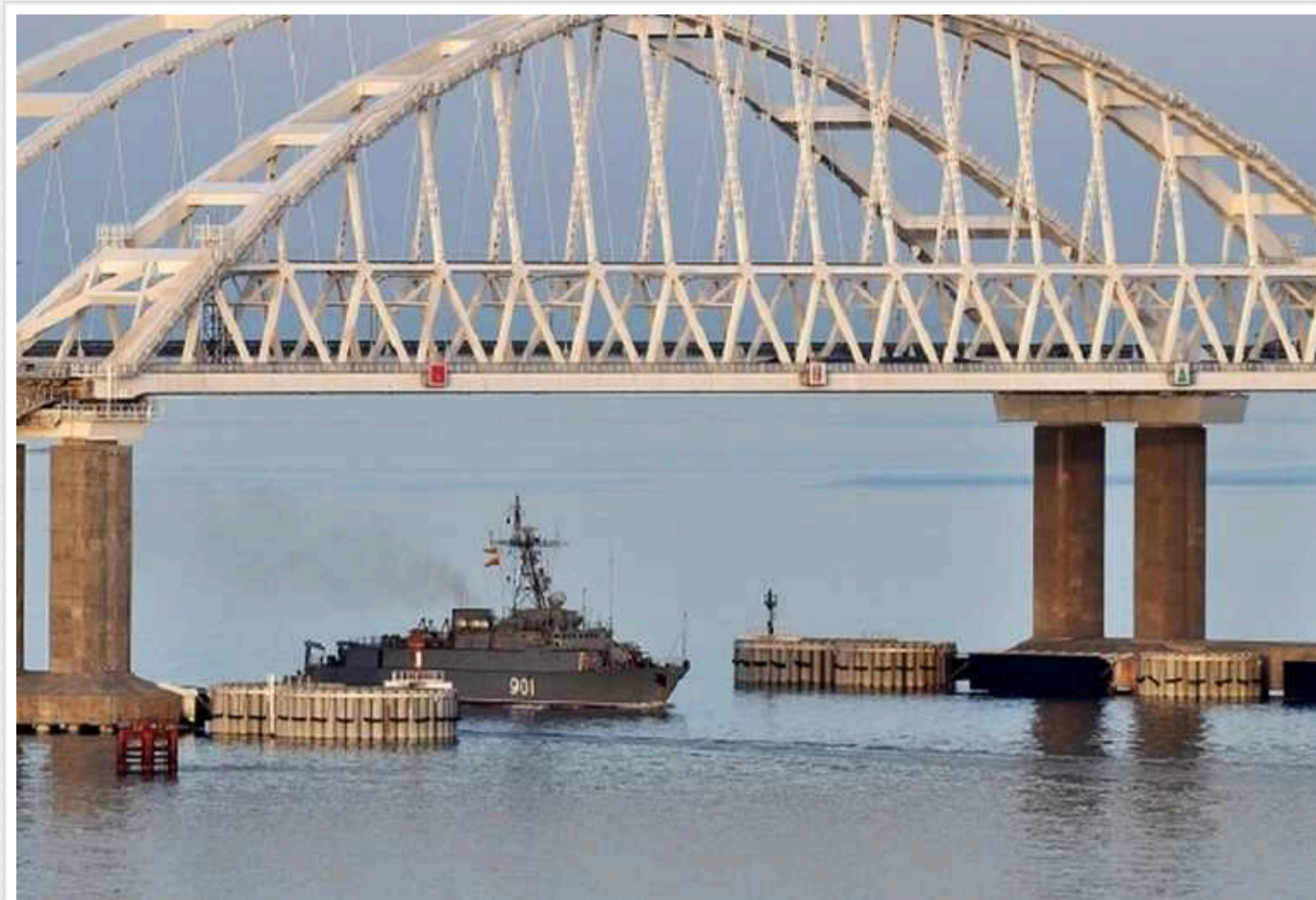
СБУ про Кримський міст: будуть сюрпризи, він приречений

Україна змогла двічі уразити Кримський міст – у жовтні 2022 року та у липні 2023 року. Завдяки інженерам та військовим Україна й надалі влучатиме по конструкціях мосту.