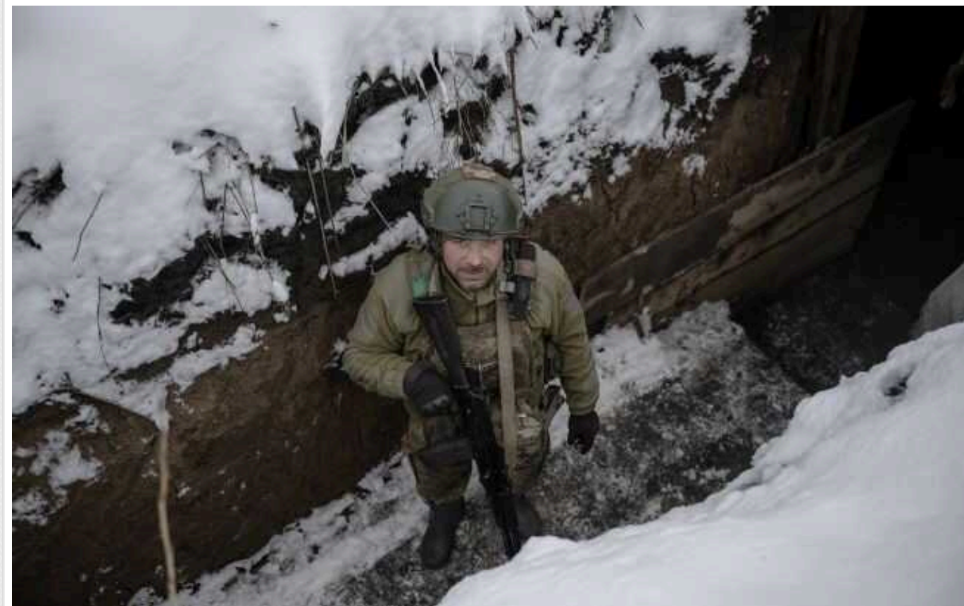
У ЦПД розповіли, що може допомогти мобілізації в Україні: "Усі воювати не будуть"