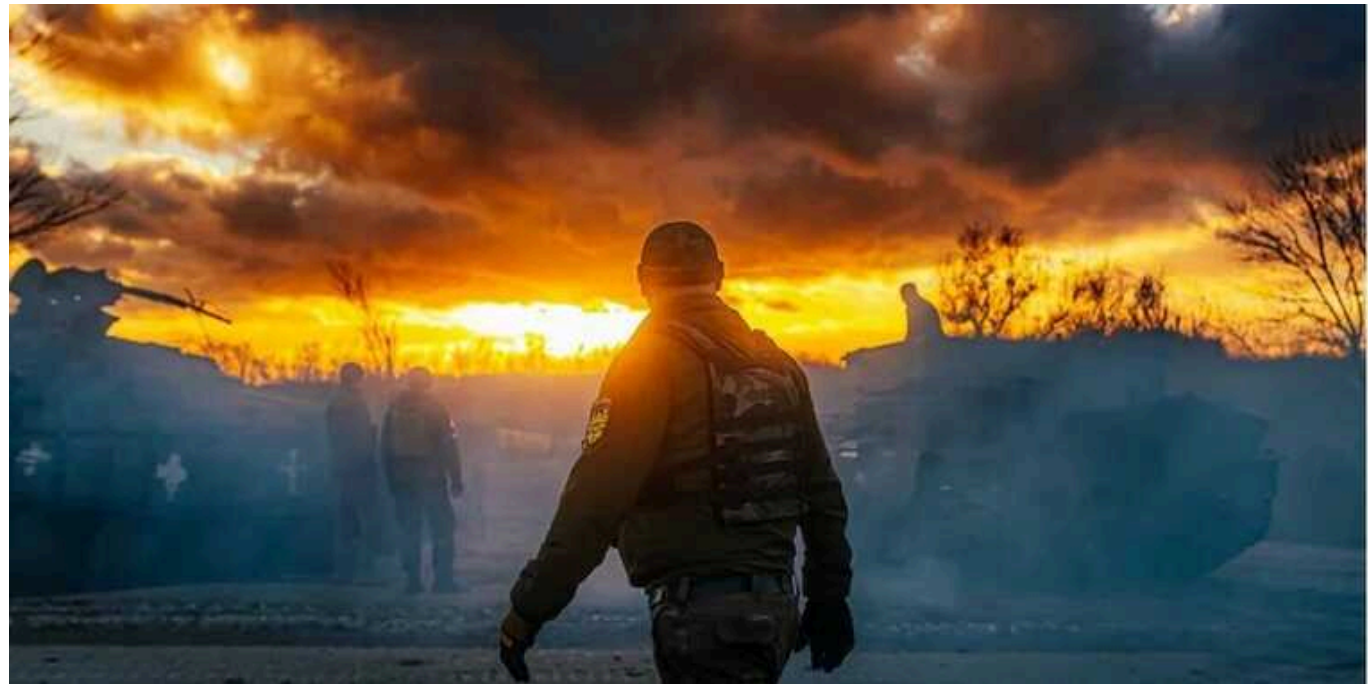
Більше за бюджет Львова: українці за рік задонатили найбільшим фондам 15,7 млрд гривень, — ЗМІ

За словами журналістів, за ці гроші фонди забезпечували Сили оборони України дронами, транспортом, медичним обладнанням, оптикою, а також зв'язком.