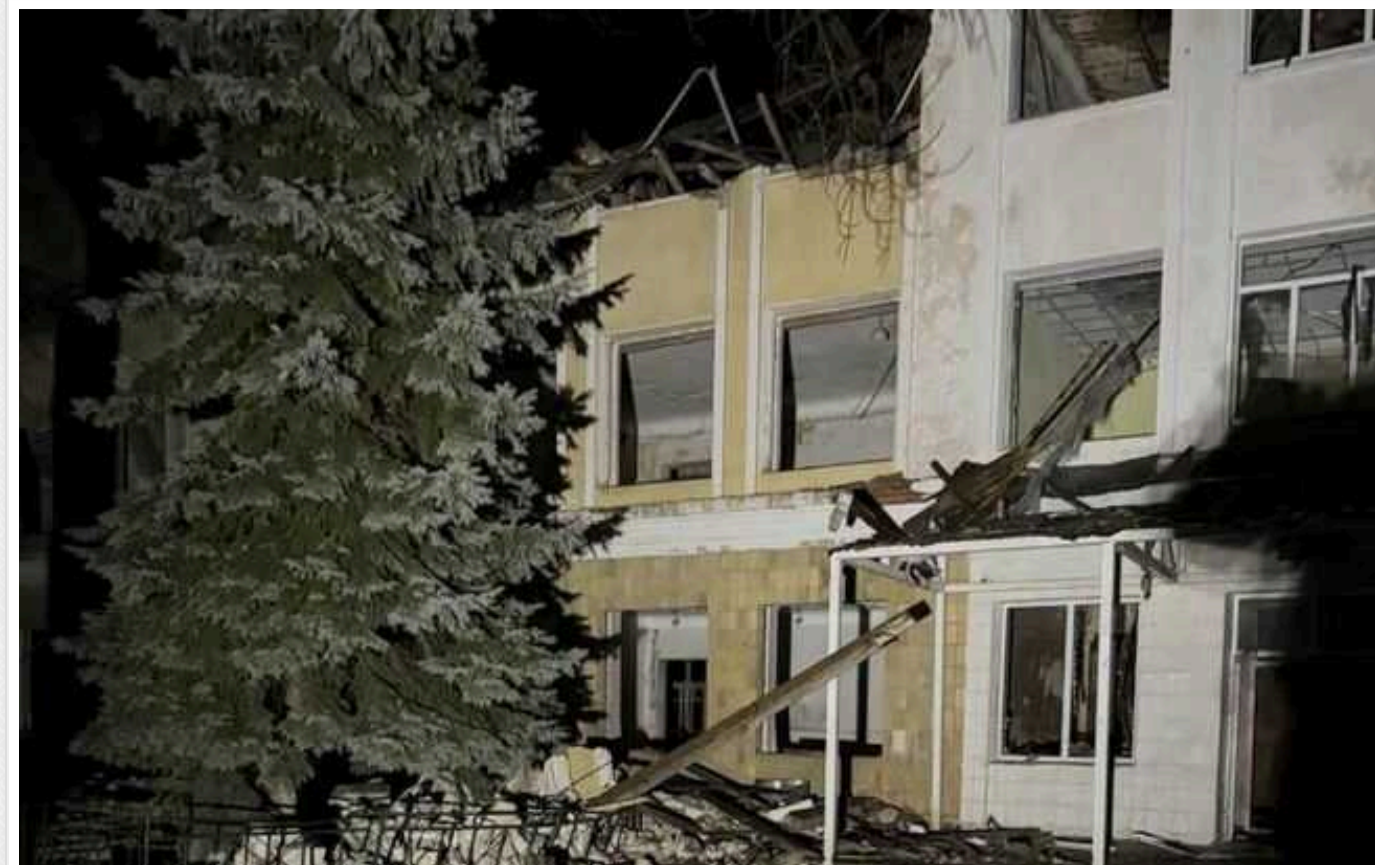
Окупанти завдали ракетного удару по центру Курахового Донецької області

Росіяни в ніч проти 4 січня завдали ракетного удару по Кураховому Донецької області. Зруйновано дитячий садок та школу.