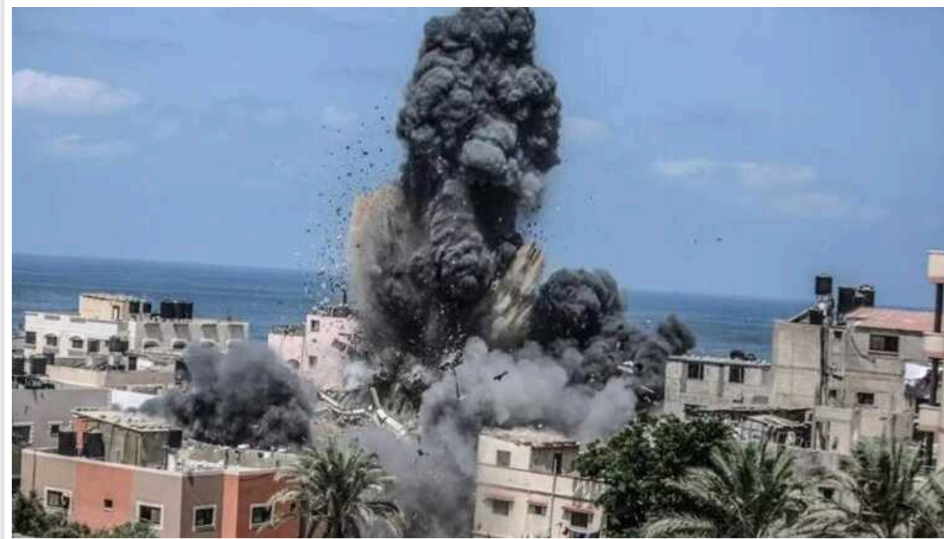
Ознак геноциду у Газі з боку Ізраїлю немає, – Держдеп США

Метью Міллер, речник Державного департаменту США, заявив, що Вашингтон завжди був прихильним до розв'язання гуманітарної ситуації у Газі.