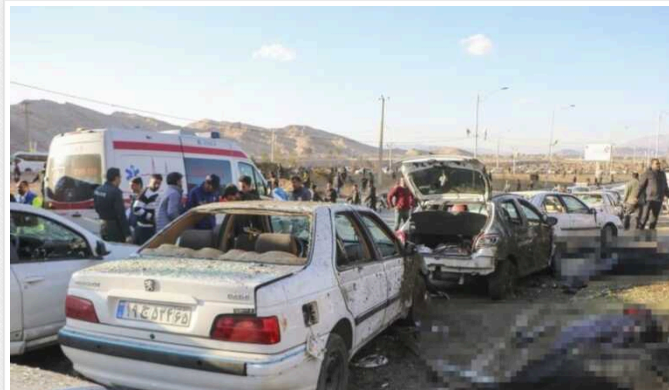
Вибух на поминках Сулеймані біля цвинтаря у Кермані: Іран пообіцяв жорстку відповідь

За останніми даними, внаслідок вибуху на цвинтарі в іранському Кермані, де проходили жалобні ходи на честь четвертої річниці смерті генерала Касема Сулеймані, загинули 103 особи та понад 200 постраждали.