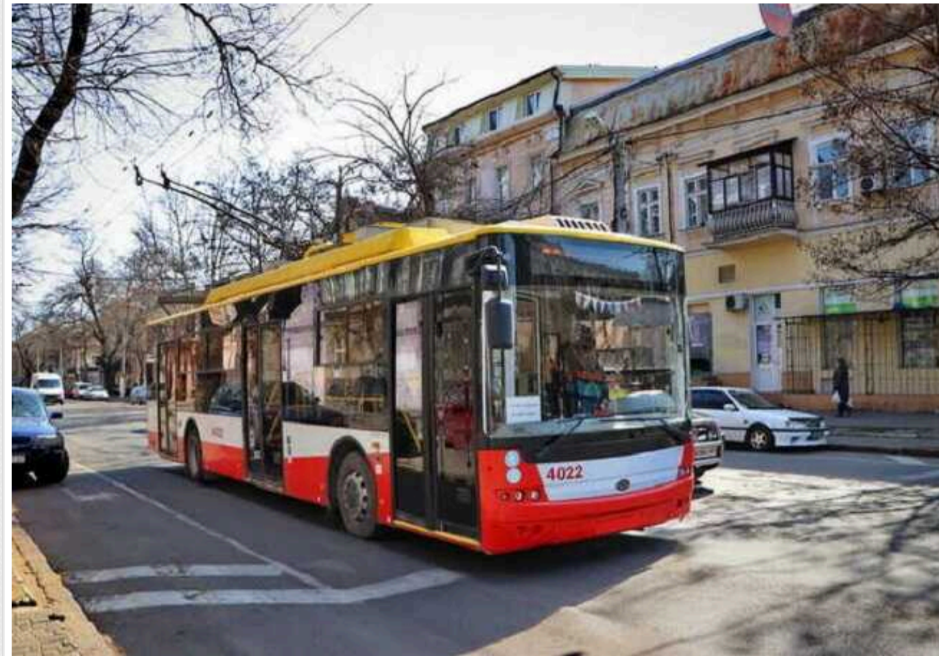
В Одесі не вистачає водіїв на міські автобуси через мобілізацію чоловіків

В Одесі через мобілізацію населення виник брак водіїв автобусів, тому влада хоче набирати і навчати водінню жінок.