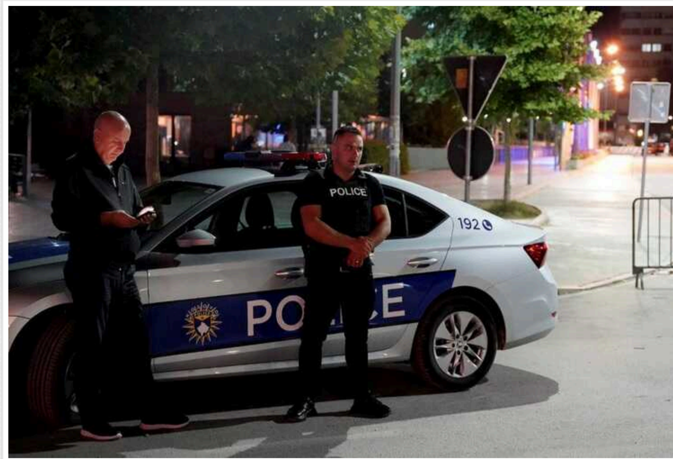
3 Мексики до США в грудні нелегально прибула рекордна кількість мігрантів

Кількість незаконних мігрантів, які прибули до США з боку Мексики у грудні 2023 року, перевищила 302 тисячі осіб. Це абсолютний історичний рекорд.