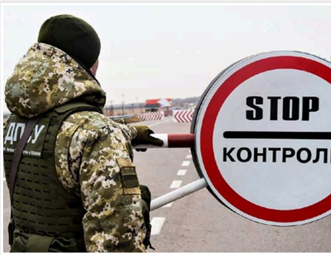
Батька 8 дітей не випустили за кордон: прикордонники вимагають замінити у військовому квитку одне слово

Багатодітного батька вісьмох дітей не випустили за кордон, вимагаючи звернутися до ТЦК та замінити у військовому квитку слово "зняттям" на "виключенням" у фразі про зняття з військового обліку.