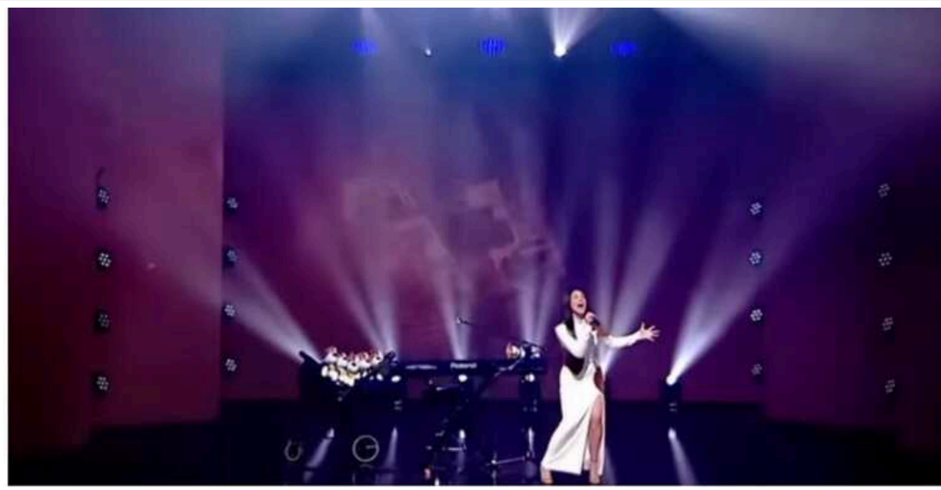
"Квартал 95" переспівав пісню "Соколята" Хурсенка без дозволу: донька співака заявила про порушення авторських прав