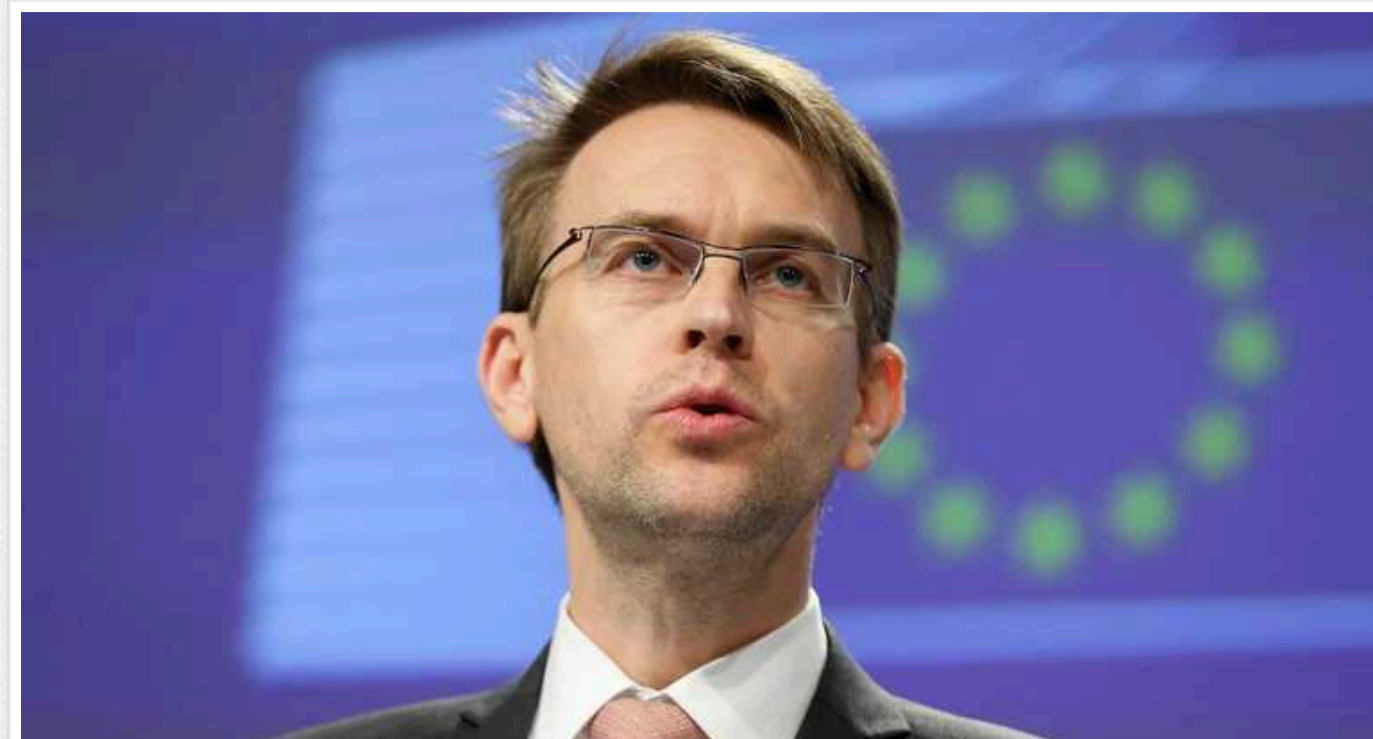
"Україна має законне право захищати себе від агресії", - Петер Стано про удари України по території РФ

Україна має "законне право захищати себе", заявили в ЄС на запитання російських журналістів про нещодавні обстріли Белгорода, через які загинули десятки людей, включаючи п'ятьох дітей.