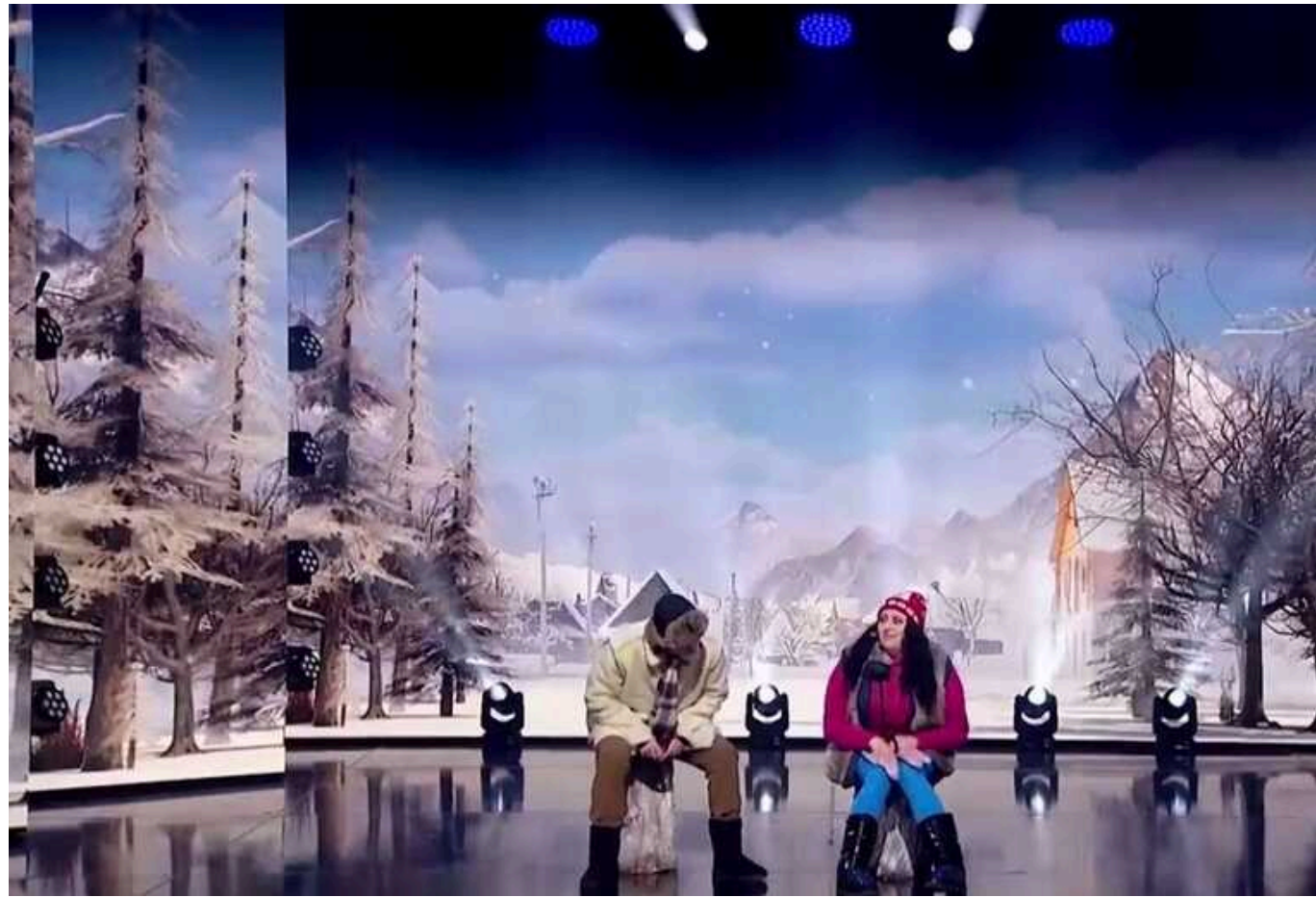
Скандал із "Кварталом 95": Телеканал "1+1" видалить номер про переселенку зі Скадовська

У телеканалі "1+1" повідомили, що видалить скандальний номер "Кварталу 95" про переселенку зі Скадовська.