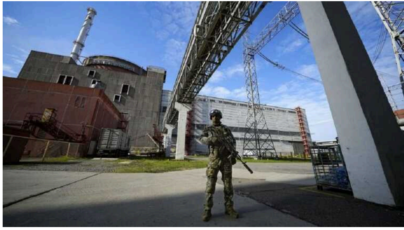
МАГАТЕ два тижні не пускають до частини реакторних залів на Запорізькій АЕС

Експертів Міжнародного агентства з атомної енергії не пускають до частини залів на окупованій росіянами Запорізькій АЕС.