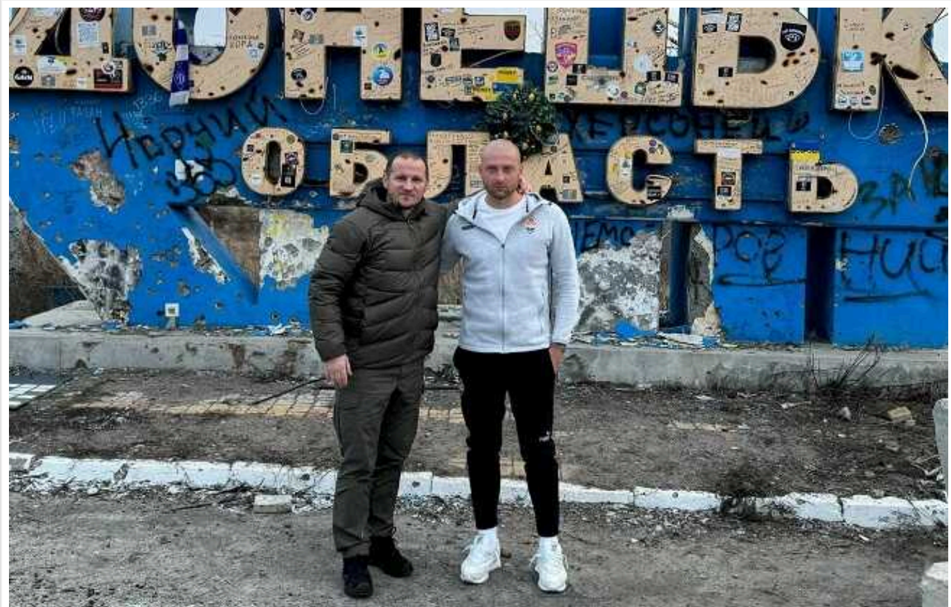
Алієв показав обличчя Ракицького під час поїздки до Донецької області та викликав бурхливу реакцію у вболівальників

Відомий ексфутболіст київського "Динамо" Олександр Алієв і захисник донецького "Шахтаря" Ярослав Ракицький з'їздили до Донецької області. Спільну фотографію 38-річний Алієв виклав у себе в Instagram.