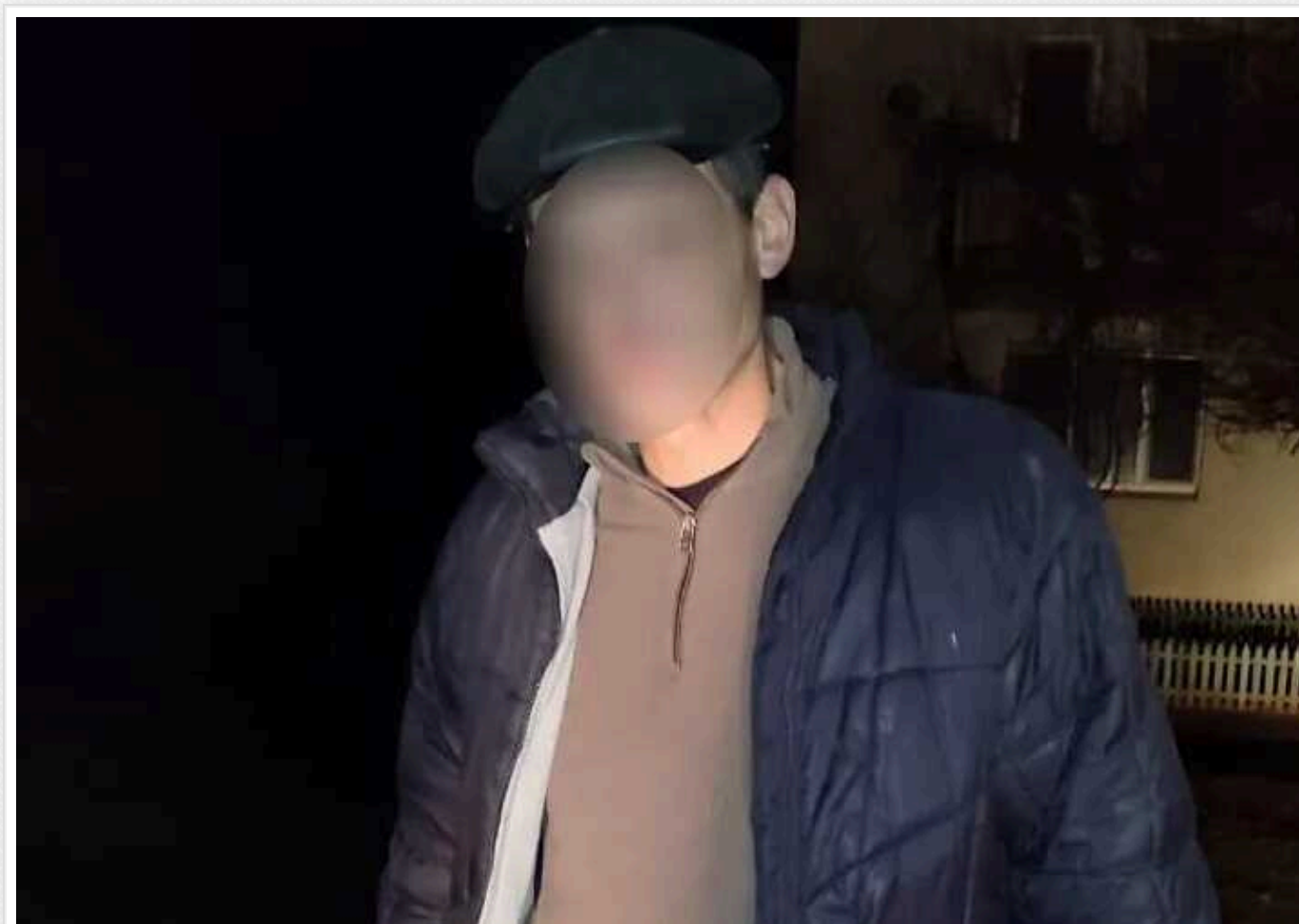
На Миколаївщині чоловік запустив феєрверк під час повітряної тривоги: чоловіку повідомили про підозру

У місті Снігурівка, що на Миколаївщині, правоохоронці викрили чоловіка, який вночі під час повітряної тривоги запустив феєрверк. Він пояснив свої дії бажанням розважитись.