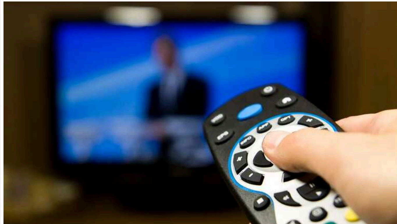
У Казахстані припинили транслювати понад 10 російських каналів

У Казахстані прибрали із сітки мовлення понад 10 російських каналів, передає The Moscow Times .