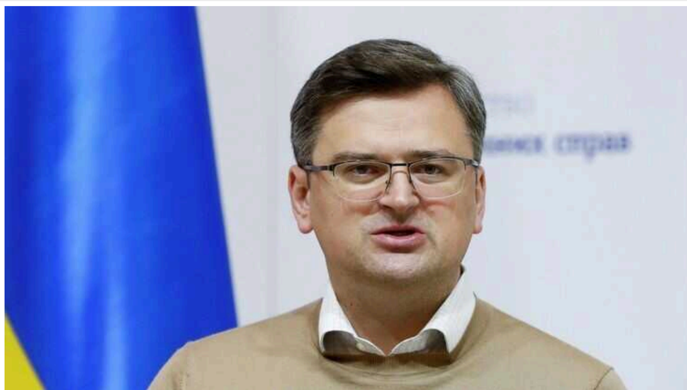
"Важливий сигнал": Україна збирає надзвичайне засідання з НАТО через обстріли РФ, — Кулеба

Глава МЗС Дмитро Кулеба заявив, що однією з ключових тем засідання стане посилення протиповітряної оборони України.