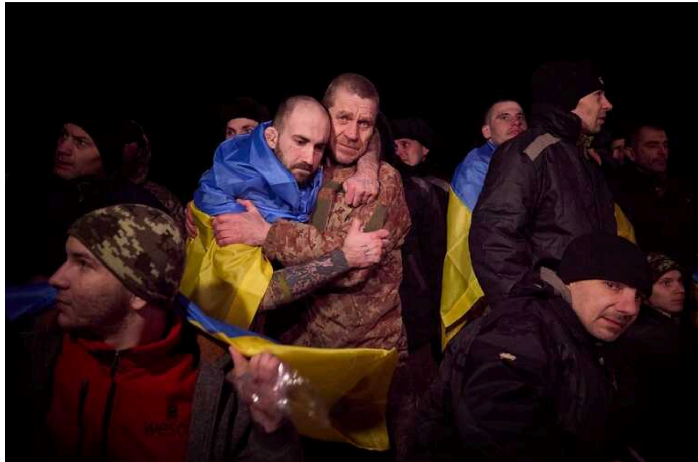
Буданов про обмін полоненими: участь в організації брали ОАЕ

Об'єднані Арабські Емірати допомогли організувати обмін полоненими між Україною та Росією, який відбувся 3 січня.