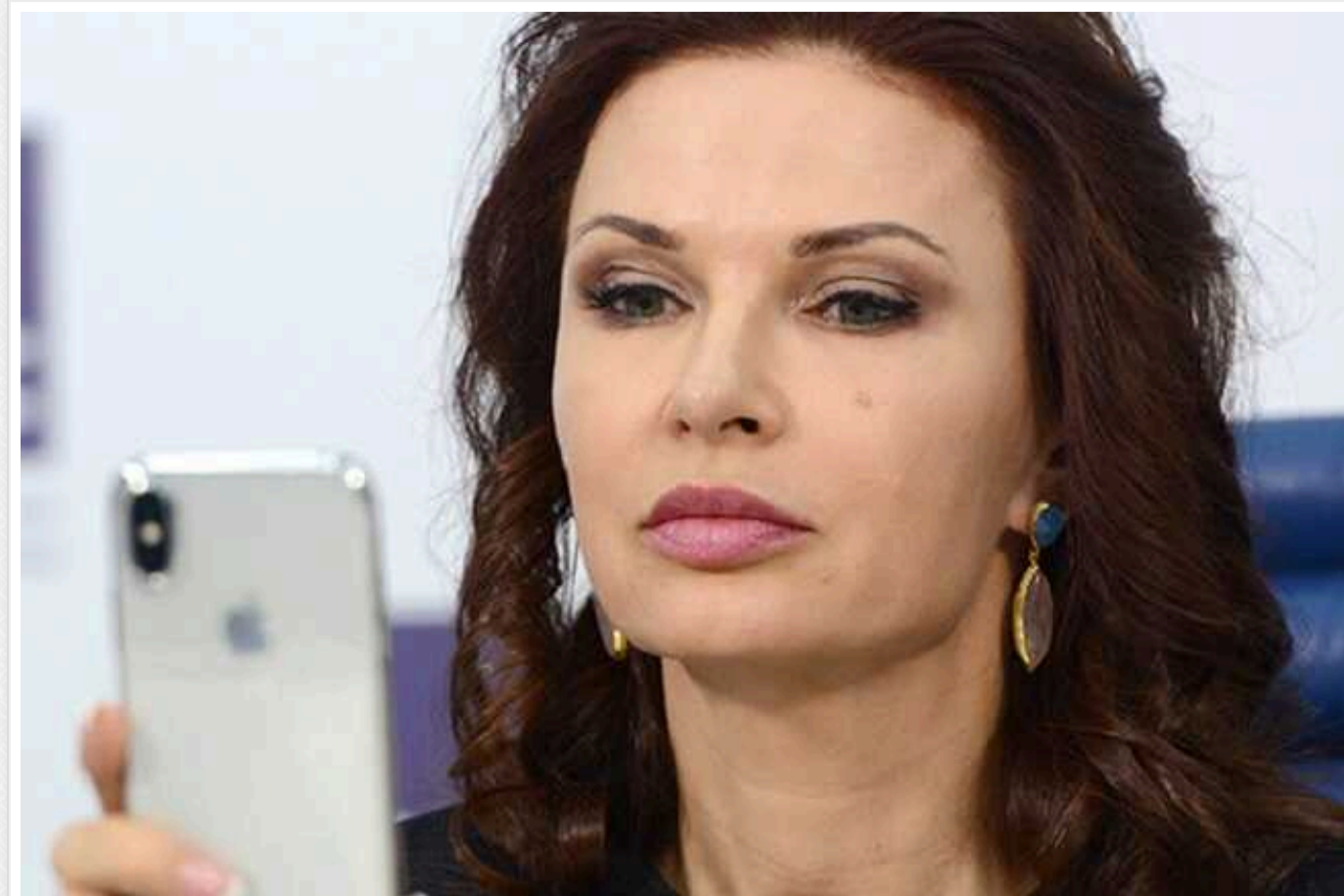
Російська ура-патріотка Евеліна Бльданс відреагувала на заборону відвідувати Україну

Російська акторка Евеліна Бльданс родом із українського тимчасово окупованого Криму відреагувала на заборону в'їзду в Україну та видала, що півострів належить їй. Мовляв, ніхто не заборонить колаборантці милуватися рідними краями.