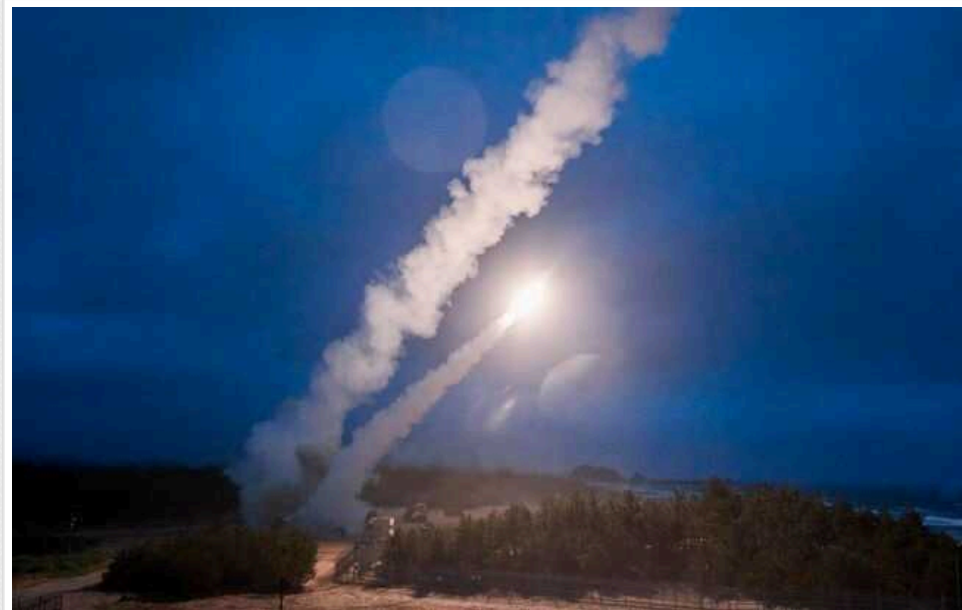
Над Дніпропетровською областю по обіді збили дві ракети

Сьогодні, 3 січня, по обіді протиповітряна оборона збила дві російські ракети над Дніпропетровською областю.