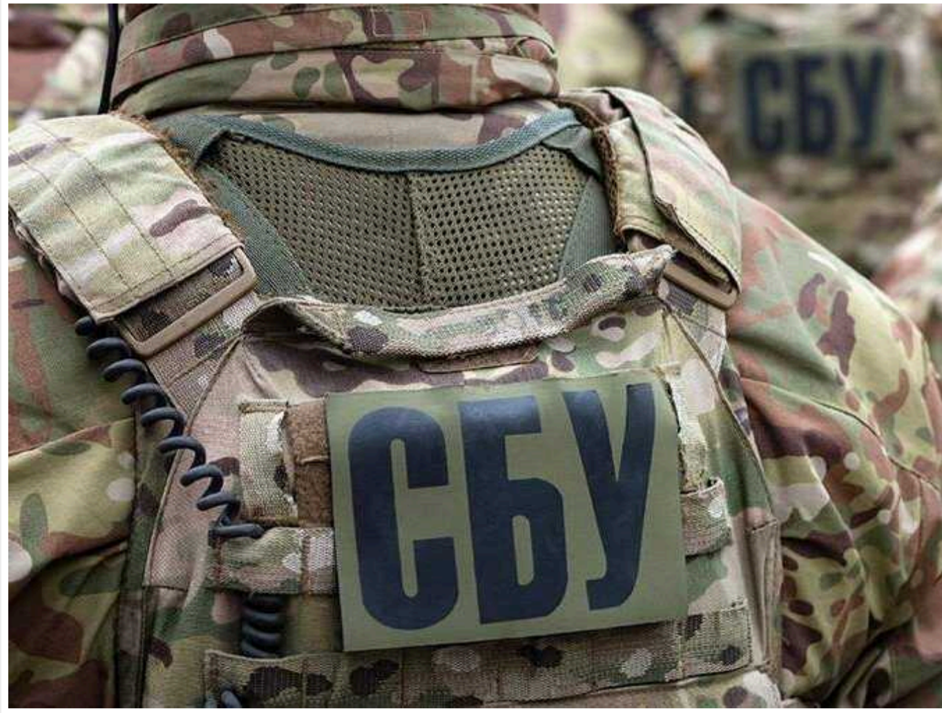
СБУ затримала людей, які розповсюджували відео "прильотів" по Києву

Служба безпеки України затримала "блогерів", які оприлюднили відео російських ударів по Києву 2 січня.