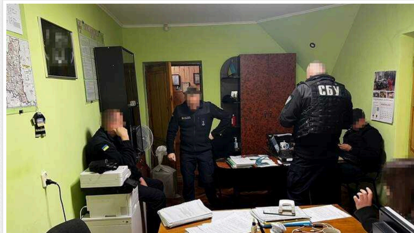
У Тернопільській області інспектори ДСНС отримували 20 відсотків відкату від договорів на пожежну безпеку

На Тернопільщині інспектори територіального управління ДСНС отримували 20% відкату від договорів на протипожежне обслуговування підприємств. Корупційну схему ліквідували працівники СБУ. Правоохоронці встановили, що службовці ДСНС зареєстрували фірми з протипожежного обслуговування на своїх родичів та знайомих і змушували підприємців укладати договори лише з обраними компаніями. Наразі одному інспектору повідомлено про підозру, а стосовно ще 9 продовжується розслідування.