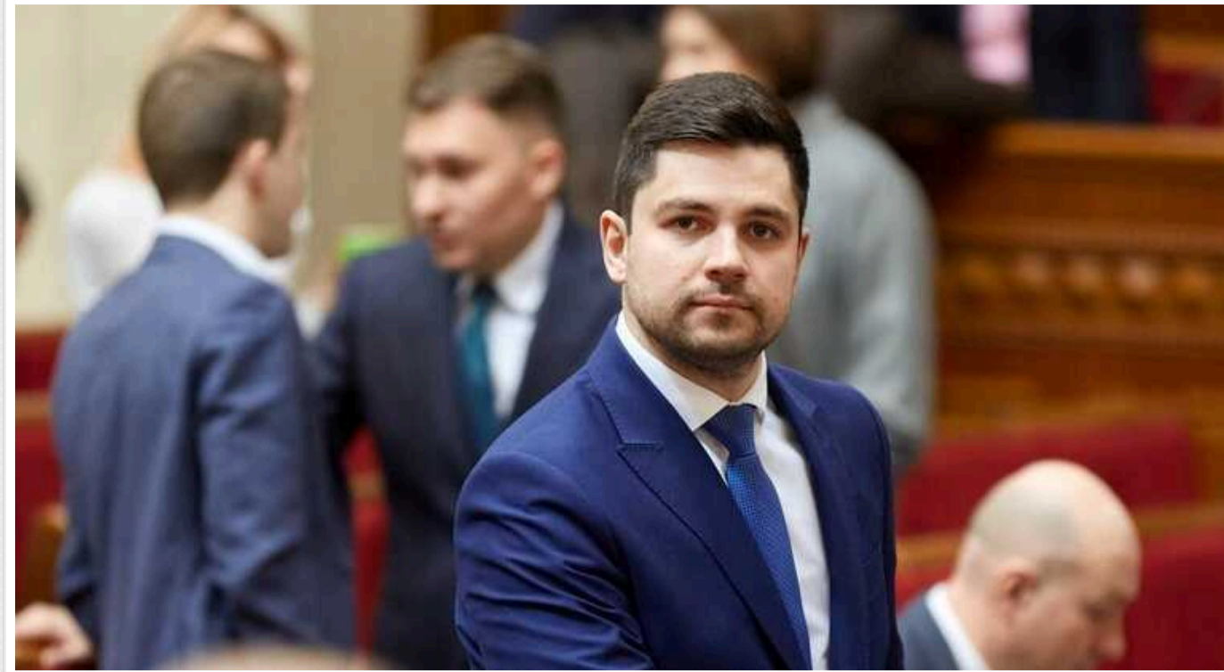
Декларація депутата Олександра Качури: не має власного житла, натомість з мільйонними заощадженнями

В Україні триває кампанія з декларування доходів та статків посадовців. На цей раз ми звернули увагу на народного депутата України, обраного від партії «Слуга народу», Олександра Качуру. Скільки заробляє та чим багатий – читайте у матеріалі.