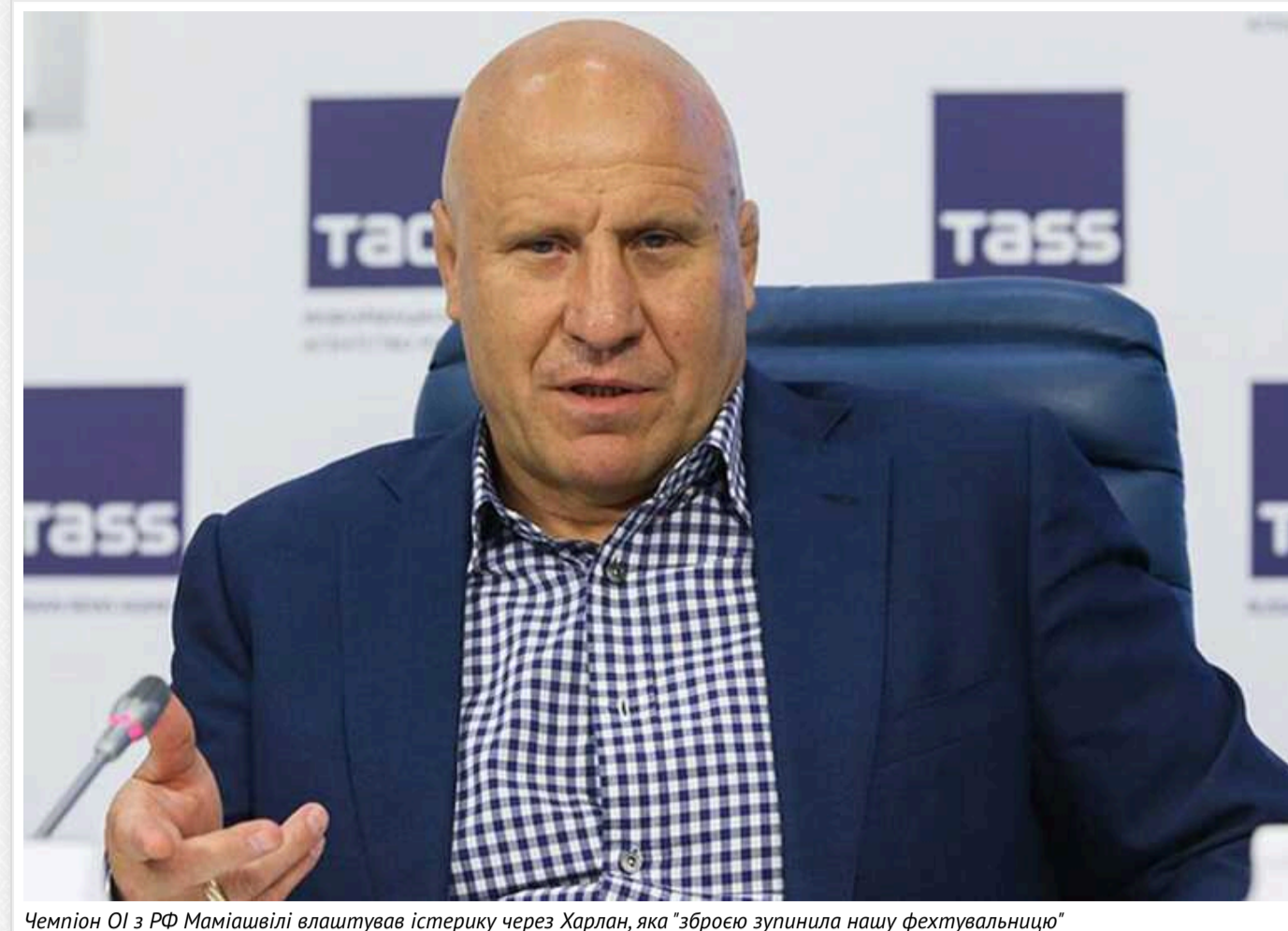
Чемпіон ОІ з РФ Маміашвілі влаштував істеріку через Харлан, яка "зброею зупинила нашу фехтувальницю"

Президент Федерації спортивною боротьби Росії (ФСБР) Михайло Маміашвілі знову розлютився через допуск фехтувальниці Ольги Харлан до Олімпіади-2024. Чемпіон Сеула-88 обурився тим, що українку не покарали за відмову тиснути руку Анні Смірновій із РФ на світовій першості-2023 у Мілані.