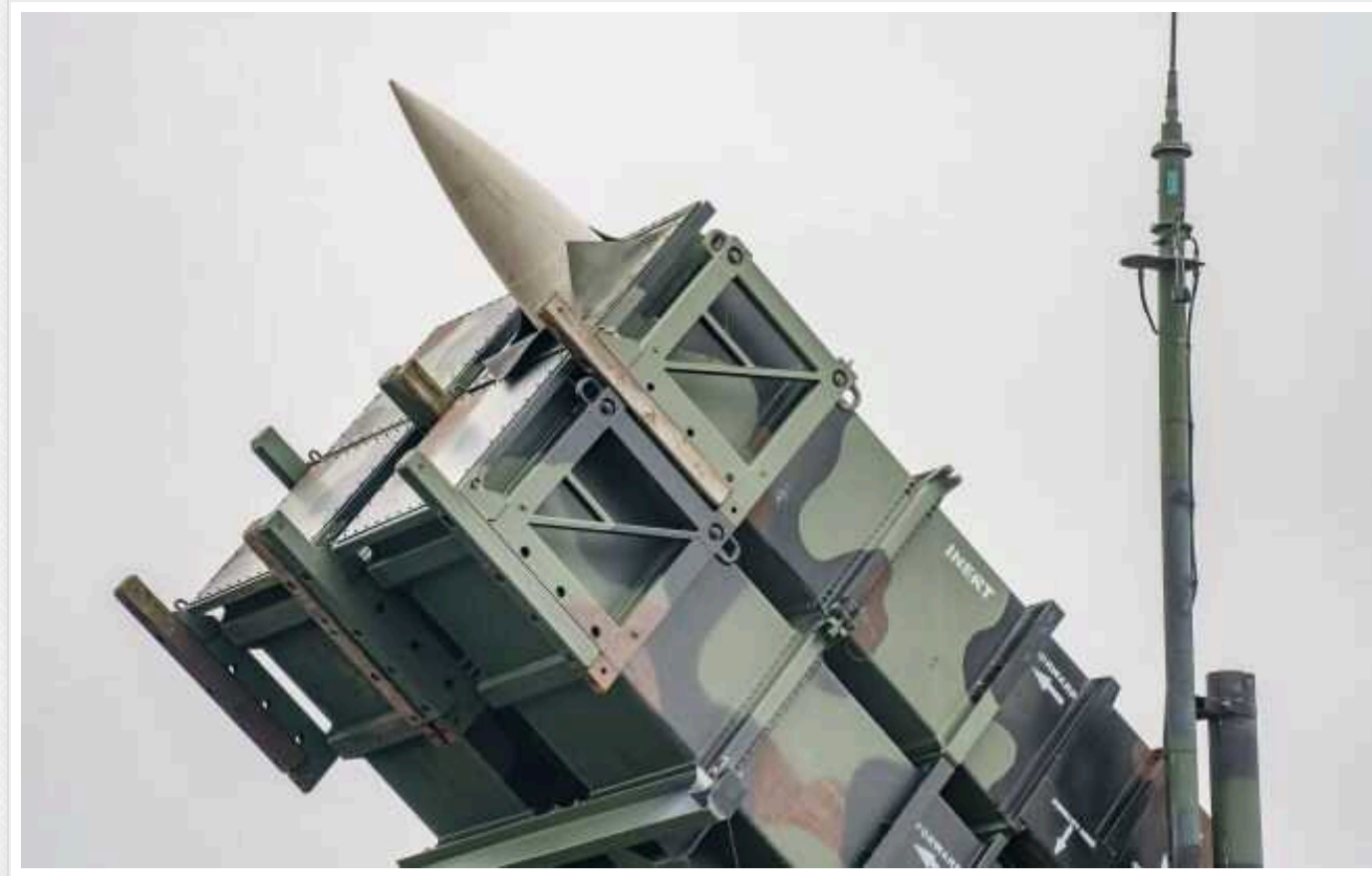
Чотири європейські країни НАТО отримують до тисячі ракет для ЗРК Patriot

Чотири європейські країни Північноатлантичного альянсу уклали угоду про закупівлю до тисячі ракет для зенітного ракетного комплексу Patriot.