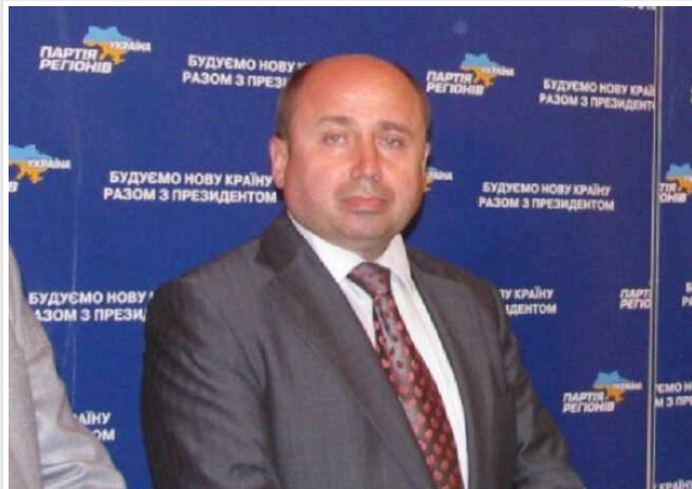
Експосадовець, який допоміг Курченку вкрати 262 мільйонів гривень в «Укргазвидобування», уникнув покарання