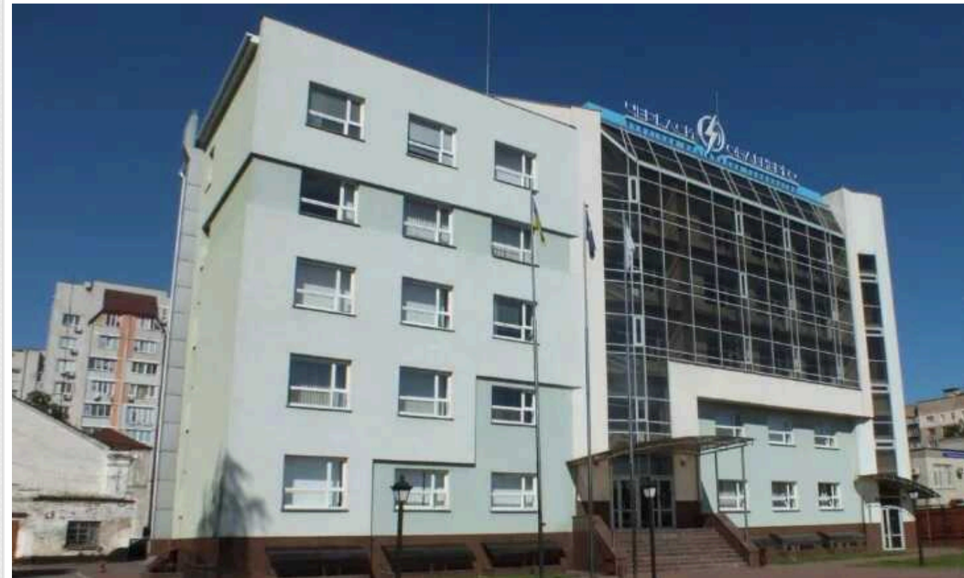
Екскрадник міністра енергетики фіктивно працевлаштувався до «Черкасиобленерго», щоб не йти до ЗСУ

Міністерство енергетики України видало доручення про необхідність проведення перевірок надання броні (тимчасової відстрочки від мобілізації) працівникам енергетичних компаній.