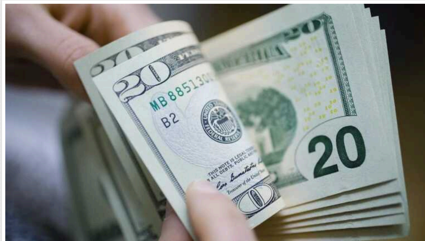
В Україні громадяни у грудні купили рекордний за понад 11 років обсяг валюти

Українці в грудні 2023 року продали банкам готівкової та безготівкової валюти на $1,57 млрд і купили на $2,596 млрд. Чиста купівля валюти склала $1,026 млрд.