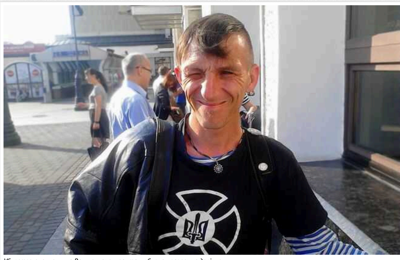
Убивство письменника Вакуленка: окупантам-вбивцям загрожує довічне

Розслідування вбивства письменника Володимира Вакуленка під час окупації частини Харківської області було завершено. Справу передали до суду.